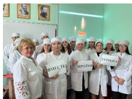
Беслан. Вечная память