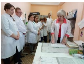
Экскурсия для студентов выпускных групп