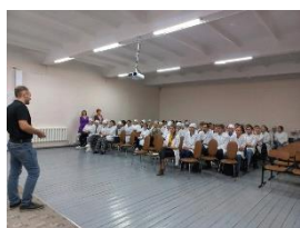
«Диалоги с профессионалами»