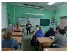
Выбор профессии и все об обучении в медицинском техникуме