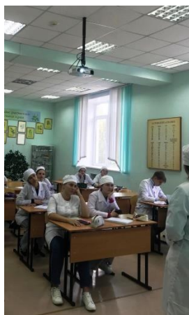
Информацию подготовил информационный сектор 411 группы.

Цель Всемирного дня безопасности пациентов – это повышение глобальной осведомленности о безопасности пациентов и поощрение международной солидарности в действиях, направленных на повышение безопасности пациентов и снижение вреда для пациентов во всем мире, как профессионального сообщества, так и самих пациентов, их родственников, различных организаций, представляющих интересы пациентов.