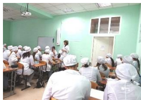
Диалог с профессионалом

#навигаторыдетства #Росдетцентр #ПодвигЗои #вдохновеннымужеством