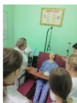
Мастер-класс "Уход за малоподвижным пациентом"