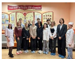
Профориентационная экскурсия «Знакомство с АМТ»