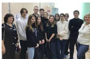
Учащиеся школы №7 на профориентационной экскурсии в АМТ