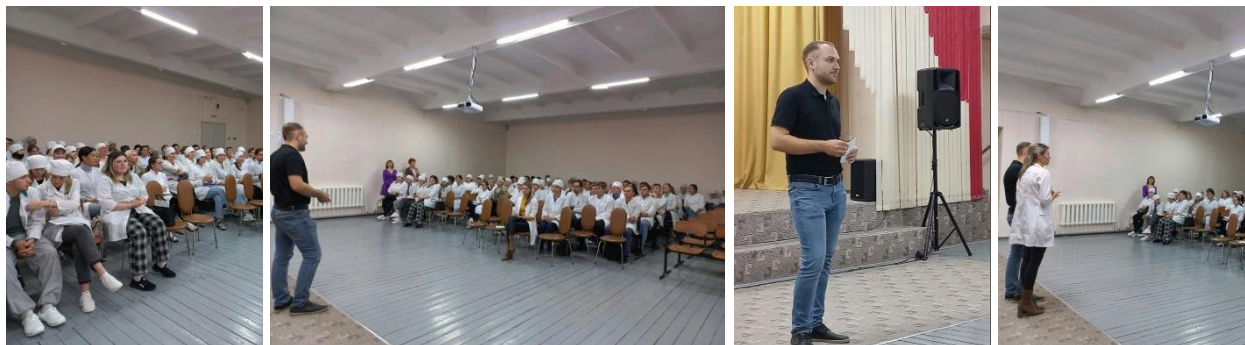
Информацию подготовила Н.Н. Кашапова