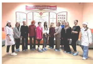
Профорientационная экскурсия для учащихся 11 класса школы №12