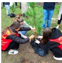
Экологическая акция «Дерево, посаженное мною»