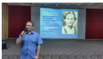
Зоя: шаг в бессмертие