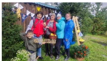
Акция «День реки Чулым»