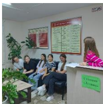
Кто на новенького?